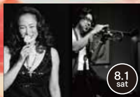
Jazz-Love Notes Live 2015

日本でも数少ないプロのデクシーランド ドジャズバンド。独特のデクシーランド スタイルをクリエイイトした「Jazz Osaka」 スタイルとして高い評価を受けている。