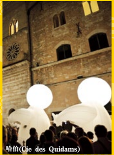
哈伯(Cie des Quidams)

Cie des Quidams是法國人氣表演團體。這次香川表演是西日本的首登場。