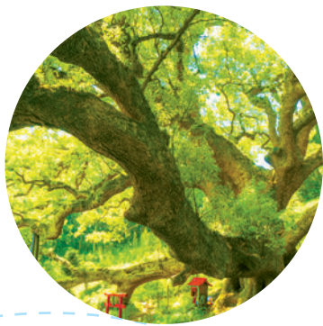
島のシンボル・樹齢1200年の大楠