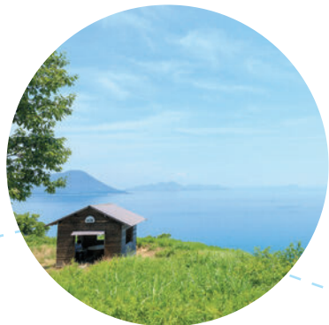
瀬戸内 オーシャンビュー！