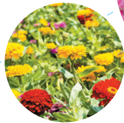
かつては、花の島と呼ばれていた。