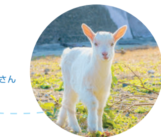
島のアイドルやぎさん