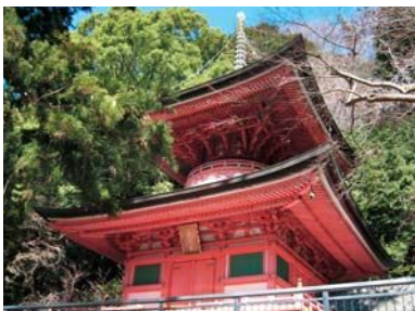
●アクセス：ことでん八栗駅から八栗ケーブル登山口駅前まで徒歩約20分、山上駅まで約4分 TEL.087-845-9603 (高松市牟礼町牟礼3416)