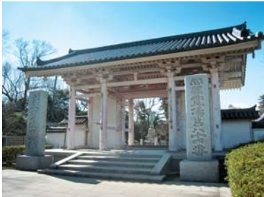
●アクセス：ことでんバス屋島山上大駐車場から徒歩約5分 TEL.087-841-9418 (高松市屋島東町1808)