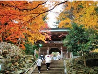
●アクセス：さぬき市コミュニティバス大窪寺から徒歩約1分 TEL.0879-56-2278 (さぬき市多和兼割96)