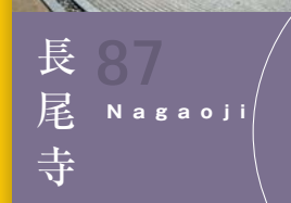
87 長尾寺 Nagaoji