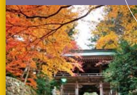
88 大窪寺 Okuboji