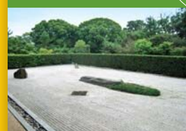
86 志度寺 Shidoji