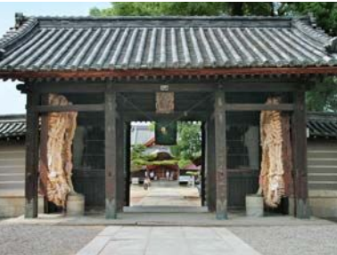
●アクセス：さぬき市コミュニティバス大川バス本社前から徒歩約5分 TEL.0879-52-2041 (さぬき市長尾西653)