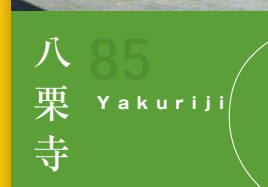
85 八栗寺 Yakuriji