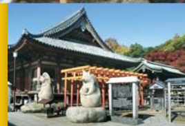
84 屋島寺 Yashimaji