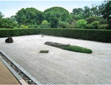
●アクセス：さぬき市コミュニティバスJR志度駅前から徒歩約10分、国道口から徒歩約5分 TEL.087-894-0086 (さぬき市志度1102)