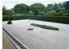
玉取り伝説を表現した 枯山水式の無染庭。

住所：さぬき市志度1102 電話：087-894-0086 アクセス：さぬき市コミュニティバスでJR志度駅前から徒歩約10分、国道口から徒歩約5分 駐車場：有