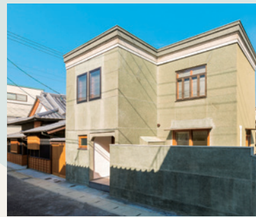
▲薄緑色のモルタル仕上げの外壁【背山】