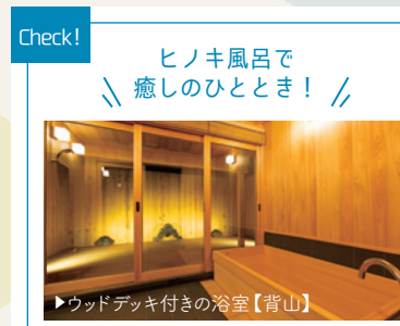
▶ウッドデッキ付きの浴室【背山】