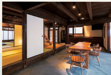
▲広い土間や天井の太い梁を活かしたダイニングキッチン【臨水】