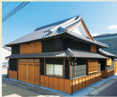
▲重厚感がある黒漆喰の外壁【臨水】

宇多津「古街の家」 宇多津町2126-1 TEL:0877-85-6941 【営業時間】9:00～18:00(不定休) (チェックイン15:00～18:00/チェックアウト10:00)