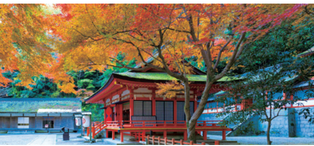
金刀比羅宮 境内地 白峰神社前「紅葉谷(もみじだに)」