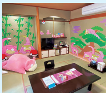
ことひら温泉琴参閣【部屋数:1部屋】