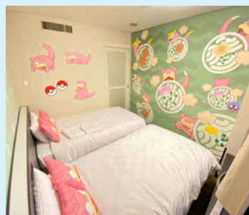
高松東急REIホテル【部屋数:1部屋】