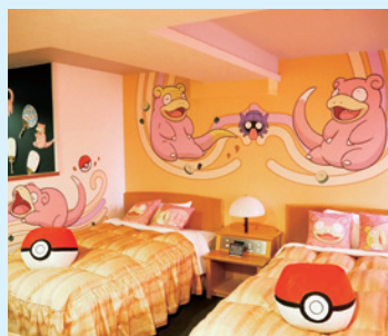
丸亀プラザホテル【部屋数:1部屋】