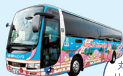
丸亀・空港 リムジンバス 1号車・2号車