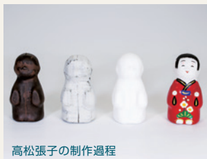
高松張子の制作過程