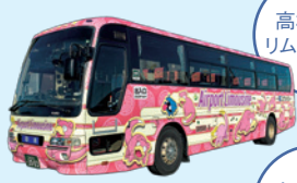
高松空港 リムジンバス