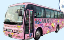
高松空港 琴平線バス