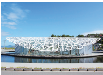
ジャウメ・ブレンサの作品「男木島の魂」

船を降りると一番に目に入る建物。貝殻をイメージした白い屋根に8つの言語の文字がデザインされています。瀬戸内国際芸術祭の作品として制作され現在は、島民と島を訪れた人々との交流の場として活用されている、男木島のシンボルです。夜はライトアップされ、昼と違った雰囲気が楽しめます。