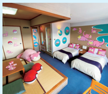
小豆島国際ホテル【部屋数:2部屋】